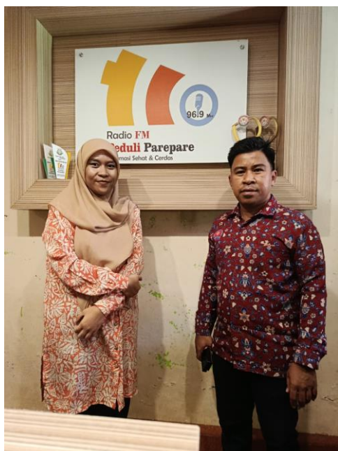
Gambar 2. Moderator dan Narasumber

Meskipun era digital berkembang pesat, radio tetap memiliki kekuatan sebagai media edukasi publik. Radio bersifat inklusif, mudah diakses, dan mampu menjangkau kelompok usia yang beragam. Ketika dikombinasikan dengan siaran langsung melalui media sosial, jangkauan pesan menjadi lebih luas.