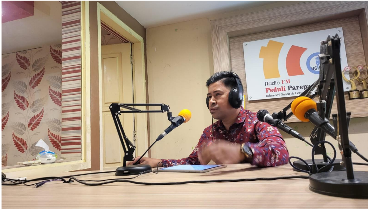
Gambar 1. Penyampaian materi di Radio Peduli

Selama siaran berlangsung, audiens berpartisipasi melalui telepon interaktif dan kolom komentar pada siaran Facebook Live. Respons yang masuk menunjukkan adanya ketertarikan masyarakat terhadap isu fluktuasi harga bahan pokok, strategi pengelolaan belanja pangan keluarga, serta pemanfaatan pangan lokal sebagai alternatif sumber karbohidrat selain beras. Antusiasme ini menjadi indikator awal bahwa isu ketahanan pangan relevan dengan kondisi riil masyarakat Kota Parepare.